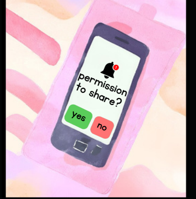
శీఘ్ర తనిఖీ చాలా దూరం వెళ్తుంది